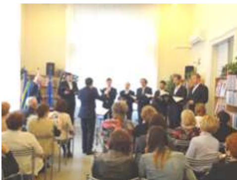
Slávnostné otvorenie Týždňa slovenských knižníc 2017

Vážení priatelia, dovoľte, aby som poinformovala o činnosti Krajskej pobočky Spolku slovenských knihovníkov a knižníc v Trnave. Zameriam sa najmä na uplynulý rok 2017 a práve prebiehajúci rok 2018. Počet členov je stabilizovaný, v súčasnosti má 85 členov. Tak ako každoročne, aj plán našich aktivít na rok 2017 sme odsúhlasili na koncoročnej spoločnej schôdzi predošlého roku.