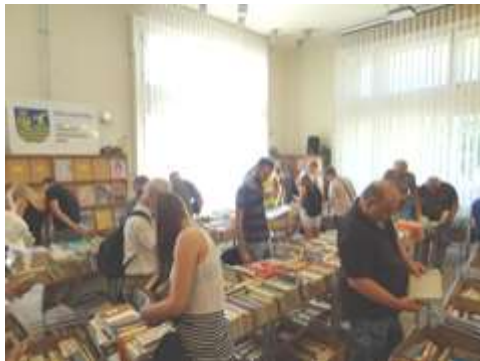
Letná burza kníh

tomných bolo 40 účastníkov, uskutočnil sa 24. mája 2017 v čítárni KJF v Trnave. Okrem Krajskej pobočky SSKK TT boli spoluorganizátormi Univerzitná knižnica Trnavskej univerzity a Knižnica Juraja Fándlyho v Trnave. Téma seminára bola zvolená k roku čitateľskej gramotnosti. Podrobnejšie sme o tomto seminári písali v Knižničnom spravodajcovi č. 2/2017 a na webovej stránke KJF v Trnave.