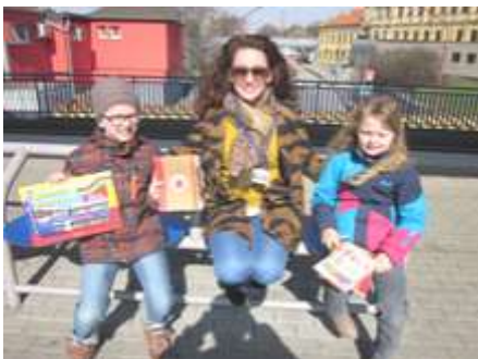
Knižničná hliadka - pristihnutí pri čítaní

Spolkový knihovnícky rok v našom kraji bol aj v roku 2017 bohatý. Od 13. do 17. marca 2017 sa uskutočnil Týždeň slovenských knižníc. Zapojilo sa 30 verejných knižníc v rámci TTSK, z toho 4 regionálne, 9 mestských, 17 obecných knižníc. Okrem verejných sa do TSK zapojili aj akademické knižnice – UK Trnavskej univerzity a UK Univerzity sv. Cyrila a Metoda v Trnave. Spolu za všetky knižnice kraja sa uskutočnilo okolo 250 podujatí, na ktorých sa zúčastnilo cca 12 000 návštevníkov. Už po druhý raz sa realizovali knižničné hliadky. Do projektu „Knižničná hliadka“ sa zapojili Knižnica Juraja Fándlyho v Trnave, Záhorská knižnica v Senici, Univerzitná knižnica UCM, prichytení čítajúci boli odmenení (zápisným zadarmo, knižkou, zľavovým poukazom, či propagačnými predmetmi). Napríklad Knižničná hliadka z knižnice UCM odmenila 22 čítajúcich.