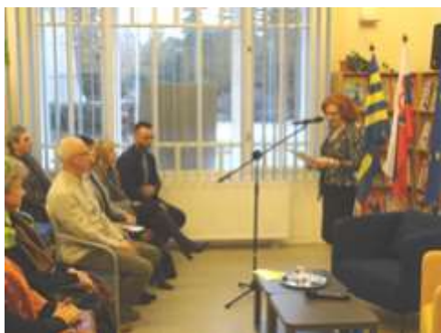
Slávnostné otvorenie Týždňa slovenských knižníc 2018