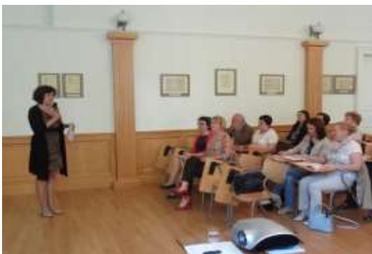
Komunikačné techniky v knižnici 2016

16. decembra 2015 sa konala slávnostná členská schôdza. Program tvorilo poetické pásmo v naštudovaní hercov DJP v Trnave s názvom „Videl som tancovať Jitterboogie“ na motívy poézie Miroslava Válka, po ktorom nasledovala členská schôdza s vyhodnotením roku 2015 a prerokovaním plánu činnosti na rok 2016.