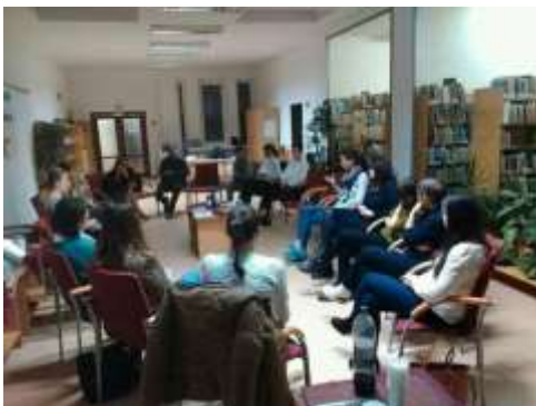
Literárny klub– členovia klubu