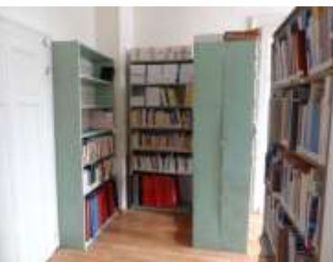
←Po rekonštrukcii ↑ Pred rekonštrukciou ↑

Revue Piešťany, Hlas Vrbového a i.). Počas pôsobenia knižnice sa podarilo vybudovať (a ďalej sa buduje) unikátny fond regionálnej literatúry, ktorý má pre súčasnú i budúcu generáciu nevyčísľiteľnú historickú hodnotu. Jeho význam možno podložiť neustálym nárastom