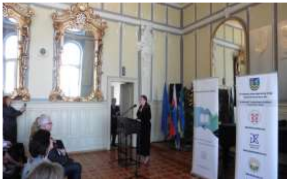
Týždeň slovenských knižníc 2015