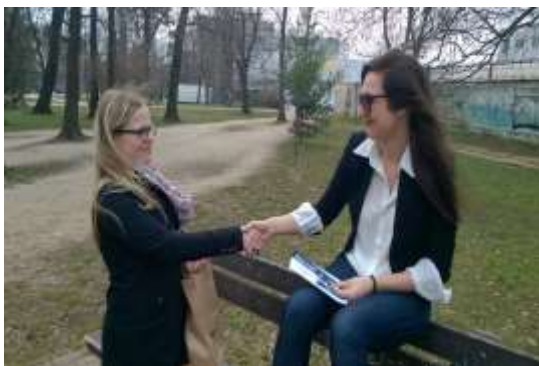
Knižničná hliadka 2015

Burza kníh sa uskutočnila v termíne od 24. do 30. júna 2015 v priestoroch čítarne Knižnice Juraja Fándlyho v Trnave. V pondelok