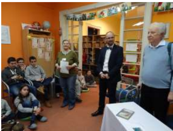
Noc s Andersenom 2018

Celoslovenský seminár Firremná kultúra a proklientský prístup v knižnici sa konal v Aule Trnavskej univerzity Pázmaneum. Seminár bol uskutočnený v rámci projektu Knižnica dokorán, ktorý z verejných zdrojov podporil Fond na podporu umenia, organizátormi boli KP SSKK v Trnave, UK TU a KJF v Trnave. Uskutočnil sa na pokračovanie v troch ter-