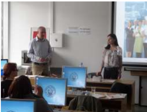
Efektívny marketing v knižniciach 2014

V máji, 29. 5. 2014 sme v spolupráci s KJF v Trnave a UK TU v prednáškovej miestnosti budovy Pazmaneum pri Trnavskej univerzite v Trnave realizovali odborný seminár Efektívny marketing v knižniciach . Jeho cieľom bolo zvýšenie odborných zručností a kompetencií pracovníkov knižníc pri využívaní internetu a bežne dostupných pc programov pri mar-