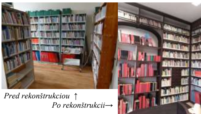
Pred rekonštrukciou ↑