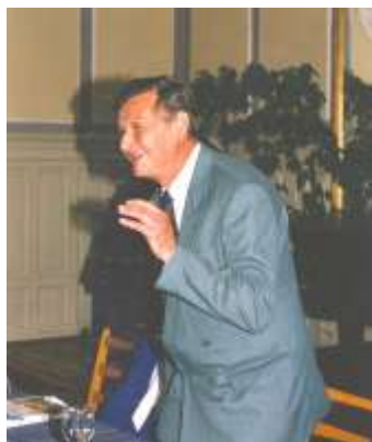
Prezentácia knihy Prvák z najmenšej lavice (2002)