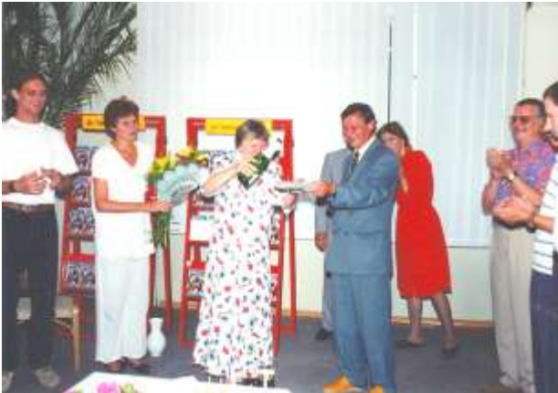
Prezentácia knihy Klub Lucia (1996)