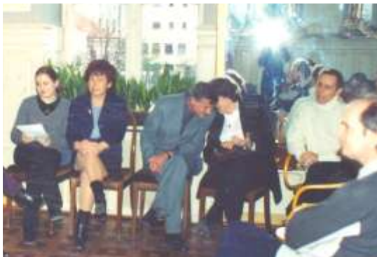
Prezentácia CD Cingi-lingi, pesnička (2001)

„Pravdaže knižku,“ prikývol som. „Muzikantom som