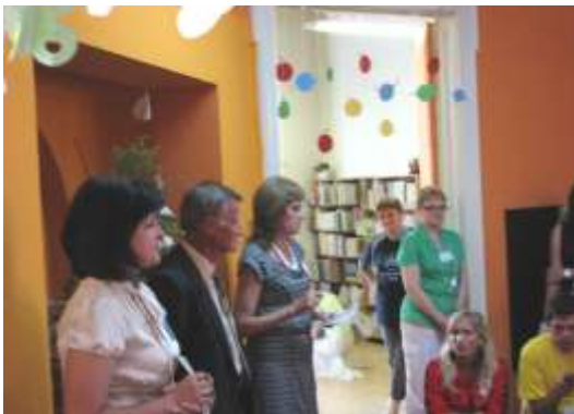
Medzi Kráľmi detských čitateľov z celého Slovenska (2009)

Prežil som už veľa Vianoc, keby som mal vyjadriť ich počet krížikmi na papieri, bolela by ma z toho ruka. Matematiku však prenechám učiteľom. Radšej sa pokúsim zhrnúť svoje vianočné skúsenosti do jednej vety. Znie takto: