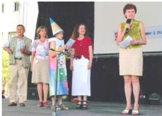
Narodeninová oslava 10. výročia časopisu Čaruška (2005)

Odpoviete mi, že listy zo stromov na zimu opadajú. Je to pravda, no nie úplná. Máme v byte fikus benjamín, ktorý má aj v zime nádherné zelené listy, a nikto naň nezavesí ani salónku. A čo módne umelé