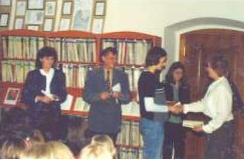
Vyhodnotenie literárnej tvorby detí a mládeže Kľúč ku šťastiu (2002)

ju nazval preto, lebo mi to dodáva optimizmus. Ak dieťa knižku prečíta, zahrá mu v duši a máš po probléme. Muzikanti v duši, na rozdiel od svojich kolegov v žalúdku, nikdy nestíchnu. Naopak, sýti sa ešte viac, ešte hlasnejšie rozohrajú a zvolávajú k sebe kamarátov. Chcú hrať duo, trio, kvarteto, založia spolu kapelu, časom obrovský orchester a detskú