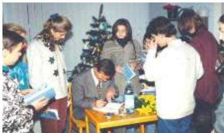
Stretnutie s čitateľmi (1997)