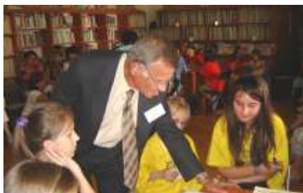
Medzi Kráľmi detských čitateľov z celého Slovenska (2009)

Želám vám všetkým bystré orlie oči a čistú, detskú myseľ. (2004)