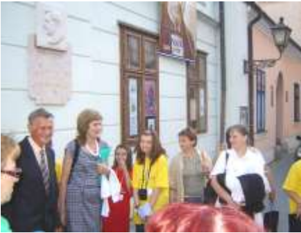
Medzi Kráľmi detských čitateľov a ich knihovníkmi z celého Slovenska (2009)

Blížia sa prázdniny, kamaráti, počas ktorých využívame pohostinnosť prírody častejšie ako inokedy, a mne prichádza na um nasledovná spomienka.