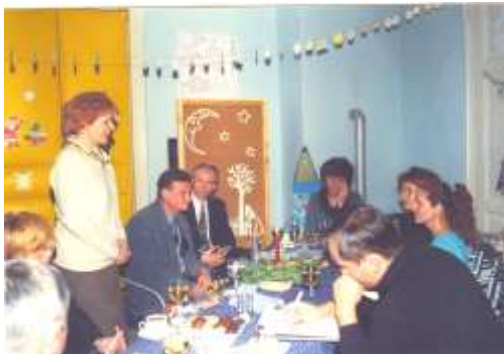
Vernisáž výstavy výtvarných projektov detí na tému Sme deti sveta, chráňte nás (2001)