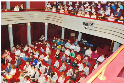
Publikum v Divadle Jána Palárika

Festival kníh pre deti a mládež sa každoročne uskutočňuje v inom meste Slovenska. Táto tradícia je spojená s oslavami Medzinárodného dňa detskej knihy. 36. ročník tohto celoslovenského podujatia organizovala Knižnica JF v Trnave v spolupráci s Divadlom Jána