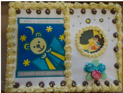
Sladká odmena nesmela chýbať